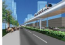
モノレールシステム