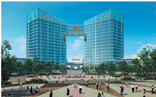
省庁などの政府機関が入居するシティホール

また、それらの施設を支える上下水道、道路、電気、通信システムなどの各インフラの整備も予定されている。