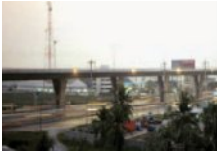
国道13号線のアップグレード