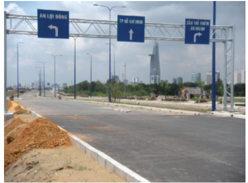
2区側でもハノイハイウェイへ繋ぐ道路工事が進む

Thu Thiemトンネルの工事は2005年2月にスタートし、2008年には川底を通す部分のトンネル4基が完成し、水中に設置されました。さらに今年の9月にはトンネルの連結が完了する予定で21日にセレモニーも予定されています。トンネルが繋がると今度は、電気システム、通気システム、照明システム等の工事が行われ、2011年には、車両の通行が可能となる予定となっているそうです。