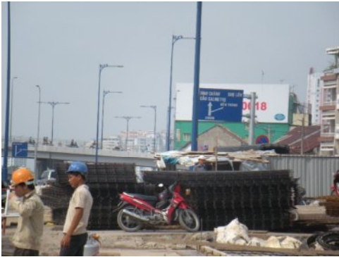
1区側の東西大通り接続部分