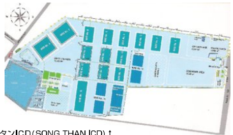
ソンタンICD (SONG THAN ICD) ↑

総面積: 500,000㎡ 倉庫エリア: 160,000㎡ CYエリア: 300,000㎡