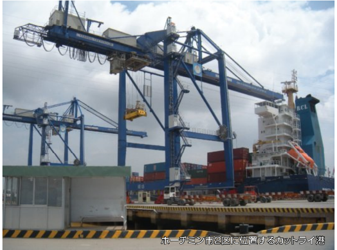
ホーチミン市2区に位置するカットライ港

今回は、ホーチミン近郊の港を開発管理する、サイゴンニューポートの情報をお届けします。