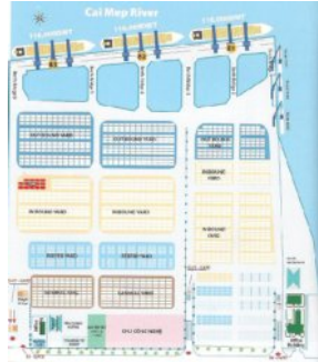
カイメップ港→ (CAI MEP PORT)

総面積: 600,000㎡ 係留施設全長: 900m-3バース コンテナ取扱量: 180万TEU/年