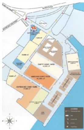
←サイゴンニューポート (SAIGON NEW PORT)

総面積: 318,879㎡ CYエリア: 275,000㎡ 倉庫エリア: 24,050㎡