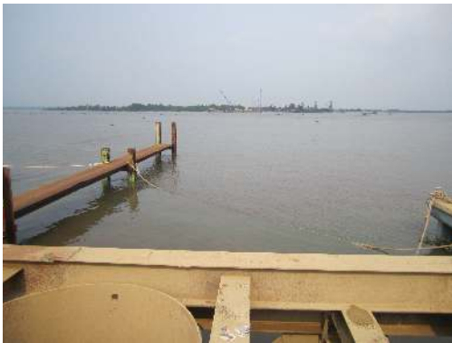
ロンタン橋が架かるドンナイ川の建設状況