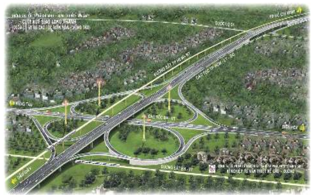
51号線と交差するインターチェンジ完成予想図