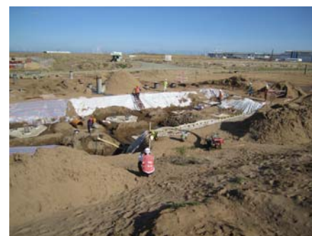
チャーバイ港の工事状況(2011年5月撮影)