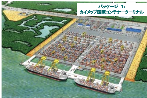
パッケージ 1: カイメップ国際コンテナターミナル