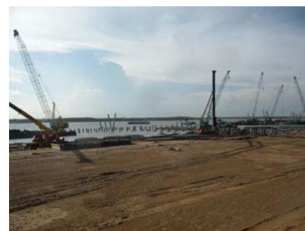
カイメップ港の工事状況(2011年5月撮影)