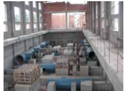
浄水送水ポンプ場建設