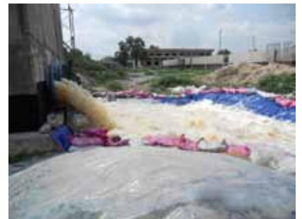
取水ポンプ運転試験