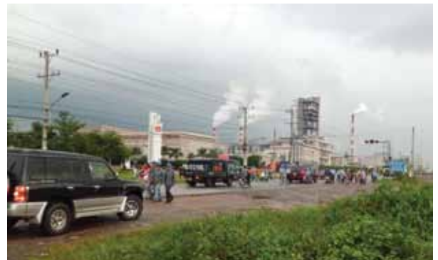
受益地の中心となるドンナイ省のノンチャック工業団地

ン国際空港などのインフラ整備が進めば非常に便利な立地条件になることが予想される地域で、今後工業団地の建設を含め更なる発展が予想される地域です。水は工業だけでなく人々の生活に欠かせないものであり、今後のドンナイ省の経済発展を支える基盤としてなくてはならないものだけに、日本のODA援助により上水道の整備がされていることは、ベトナムにとって非常に意義のあるプロジェクトであると感じました。