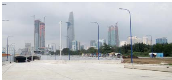
2区側サイゴン東西ハイウェイ

川底に穴を掘り、ケーソン(沈埋函)を沈めて土をかぶせる沈埋工法で作られたトンネル。4つのケーソンで接続された。