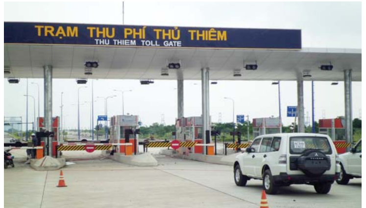
料金所にはトンネル入り口と表示されている

実際この地域は政府の副都心開発計画の予定地になっているようで、今後の2区の開発予定が気になるところです。