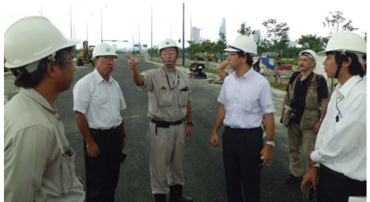
2区側での現場説明