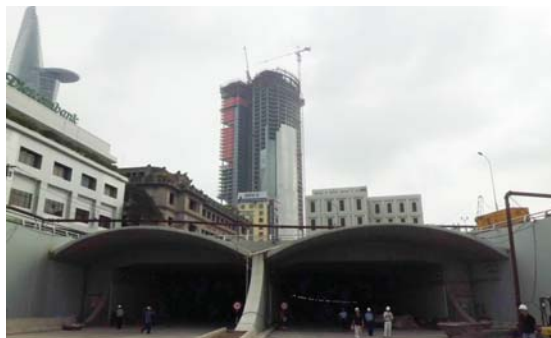
1区側のトンネル入り口