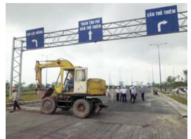
開発が進む2区のトンネルアプローチ道路