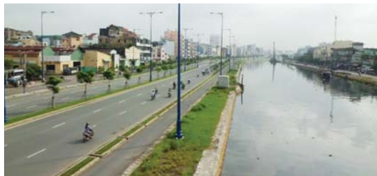
ベンゲ水路沿いのサイゴン東西ハイウェイ

トゥーティエムトンネルが開通される事により大型トラック、コンテナトラックなどが市街地を通行せずにホーチミン市東西双方への交通が可能となり、これにより市内の交通渋滞や排ガス汚染の緩和、また物流移動が格段と改善されることが期待されます。