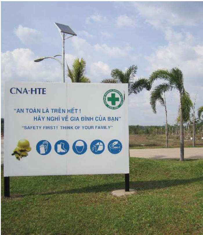
インフラ整備にも多数の実績がある