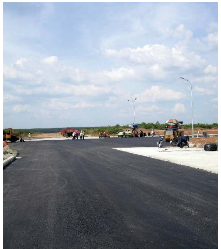
造成工事が進むアセンダス工業団地

日本の東急グループがビンズン省のニューシティ建設に投資するというニュースも最近出たばかりで、今後のビンズン省の発展が益々期待されます。