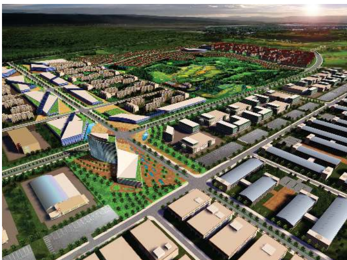
アセンダス工業団地の完成イメージ図

また、工業団地内にはレンタル工場の建設も予定されており、500㎡から1700㎡までの小規模工場建設が可能です。このレンタル工場は2012年10月に完成が予定されています。