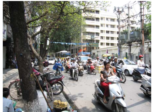
ハノイ市街の交通状況