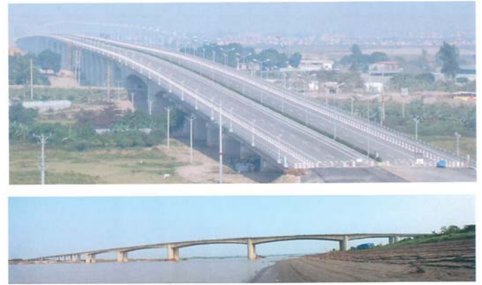
タインチ橋完成時の画像

この紅河橋(タインチ橋)建設事業の完成により、ホアラックハイテクパークやハイフォン港、ノイバイ国際空港などへ市内の交通渋滞を迂回して進むことが出来るようになりました。