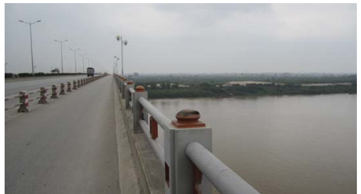
タインチ橋から望む紅河