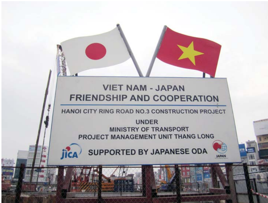
ハノイ市環状3号線整備事業の表示板(上)と工事画像(右3枚)