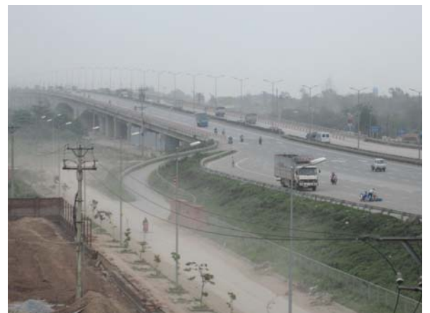
タインチ橋の交通状況