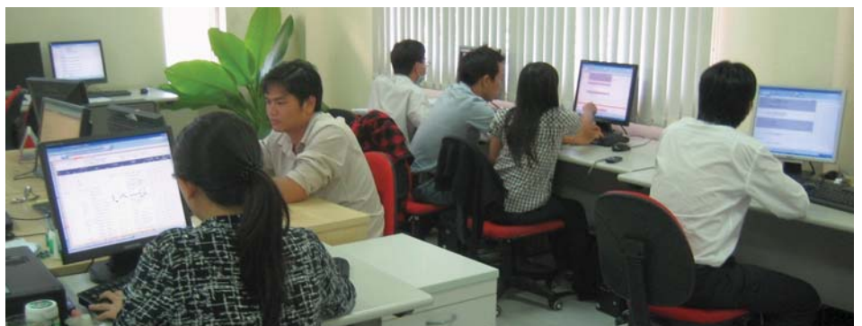
社内開発スタッフ風景