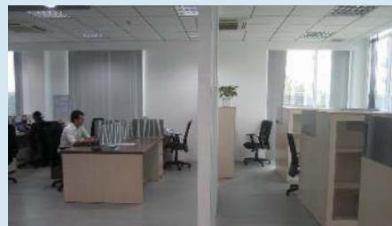
絆のオフィス(左)と入居企業の貸し固定デスクが同じスペースに

Jiji News Bulletin 時 | 事 | 速 | 報 VIETNAM