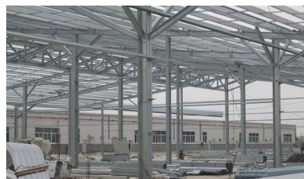
上:ゲート 左下:レンタル工場内 右下:建設中の工場