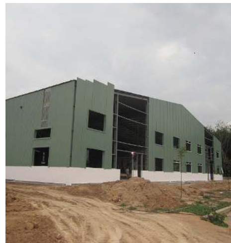
建設中のフェーズ2

Nhanh.. Nhanh nhanh Co., Ltd. Quick Quick CO.,LTD.