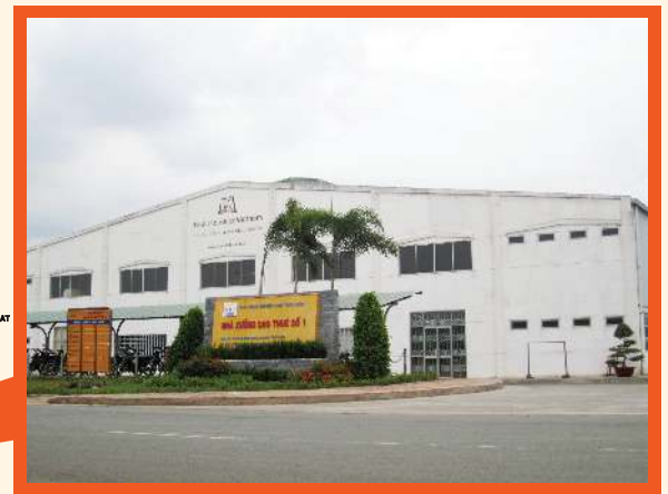
ナムタンウィン工業団地