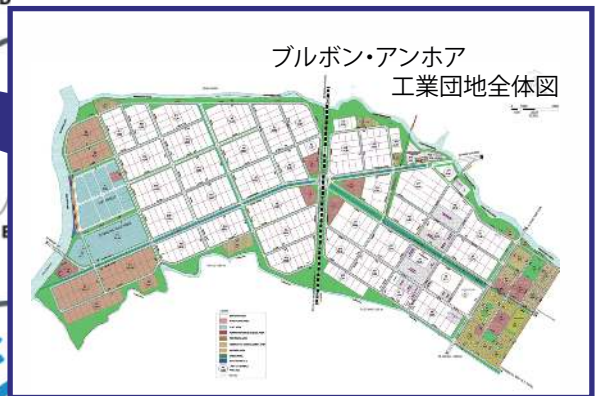
ブルボン・アンホア 工業団地全体図