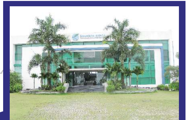
ブルボン・アンホア工業団地サービスセンター