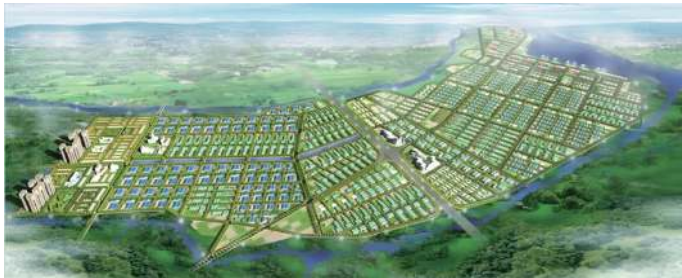
ブルボン・アンホア工業団地全体図(バース)

タイニン省はこれまで、ホーチミン市に隣接する他のドンナイ省、ビンズン省、ロンアン省などに比べて、工業化が進んでいませんでしたが、今後は、優遇税制制度や豊富な労働力により、製造業の進出が期待されています。そんな中で、タイニン省における外資系企業の進出先として期待されているのがブルボン・アンホア工業団地です。