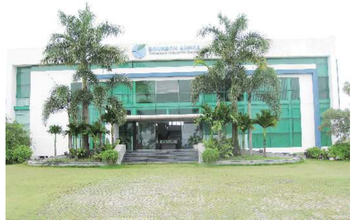
ブルボン・アンホア工業団地サービスセンター