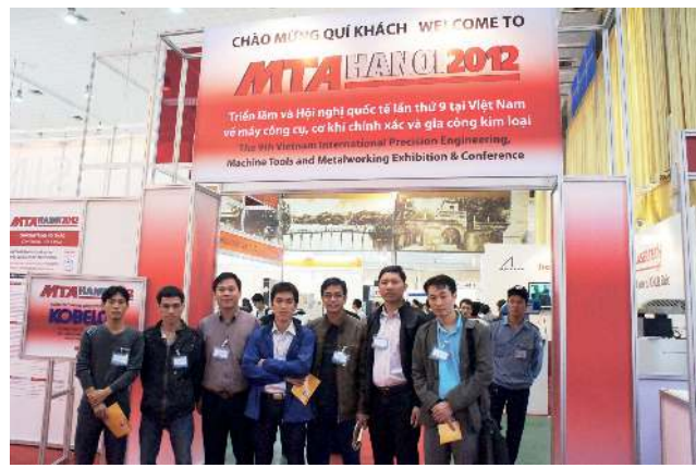
Singapore Exhibition Services Pte Ltd概要