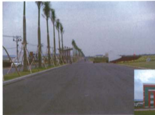
整備が行き届いた工業団地入り口ゲート

また、工業団地の側面には水路があり、これを利用してミトー港やサイゴン港へ貨物を運ぶことも可能です。