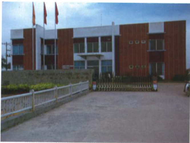
Long Giang工業団地管理事務所