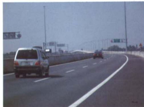
ホーチミン-チュンルーン高速道路

ロンジャン工業団地は、ティエンジャン省タムフック県タンラップ1に位置しており、ホーチミン市からおよそ50km、ティエンジャン省の中心都市であるミトー市から約15kmに位置しています。総面積は600ha有り、そのうち540haが工業用地となっており、残りの60ヘクタールはサービスエリアとして、寮やスポーツ施設、銀行などが建設される予定になっています。2007年にライセンスを取得後、2008年から造成工事を進め、現在は第1期150haの造成工事が終了しています。現在までの同工業団地への進出ライセンスを取得済みの企業は7社で、6社が工場建設中で、1社は既に活動を開始しています。