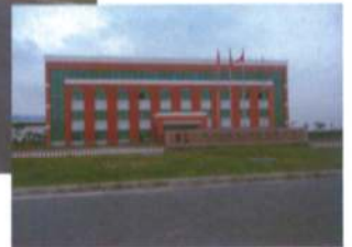
入居済みの銅加工企業HAILIANG

ロンジャン工業団地は、立地的には比較的遠距離に位置していますが、高速道路などのインフラの整備が進むことでアクセスが良くなるのが期待されており、更に賃料や優遇税制の問題を考えた場合、進出先の候補として魅力ある工業団地といえるかもしれません。特に大型の製造業にとってはメリットが大きいと思われる。