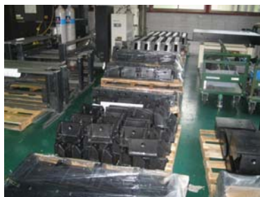
溶接機械加工部品 (工作機械・その他専用機)