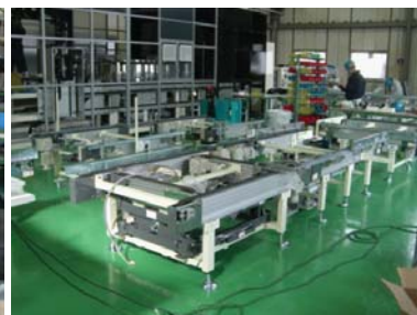
搬送装置 (制御付き・チェーンコンベアタイプ)