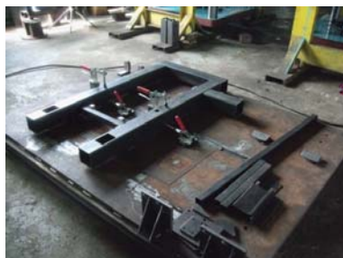
溶接製缶部品(工作機械)