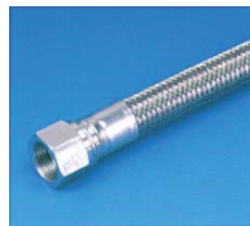
超高圧用 ストレートタイプ 特殊SUSブレード