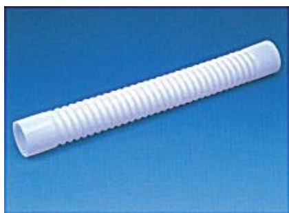
補強スプリング ブライヤブルType コンダクティブType 裸Type ブレード付Type

今回の展示会で出展しているベトナム企業について伺ってみた。ベトナムの産業はそこそこに高価な機材を導入しているものの技術が追いついていないことが目立つ。もっと彼らを育て技術を高めることで我々の求めるニーズに近づくのではないかと考えている。淀川螺旋管製作所は現在、ドンナイ省に進出しているが、ベトナム人スタッフの技術を高め生産量が増えていけばハノイにも進出をしていきたいと期待している。